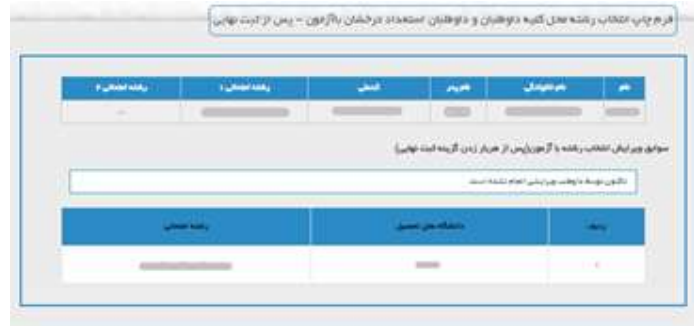
مخصوص استعداد درخشان بدون آزمون