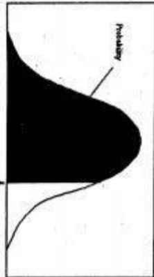
سطح زیر منحنی نرمال استاندارد